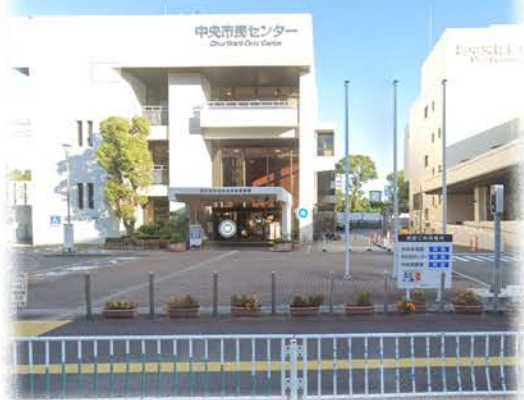
◆ストリートビュー正面写真◆